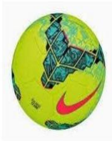
Gambar 6 Bola Futsal

saat pertandingan dimulai, berat bola minimum 400 gram dan maksimum 440 gram. Memiliki tekanan sama dengan 0,4-0,6 atmosfer ( 400\text{—}600/\text{cm}^2 ) pada permukaan laut (Asmar Jaya, 2008).