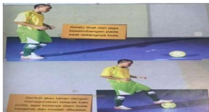
Gambar 2 Teknik Dasar Control

Teknik dasar dalam keterampilan control (menahan bola) harus menggunakan telapak kaki ( sole ). Dengan permukaan lapangan yang rata, bola akan bergulir cepat sehingga para pemain harus dapat mengontrol dengan baik. Apabila menahan bola lebih jauh dari kaki, lawan akan mudah merebut bola (Justinus Lhaksana, 2011:31).