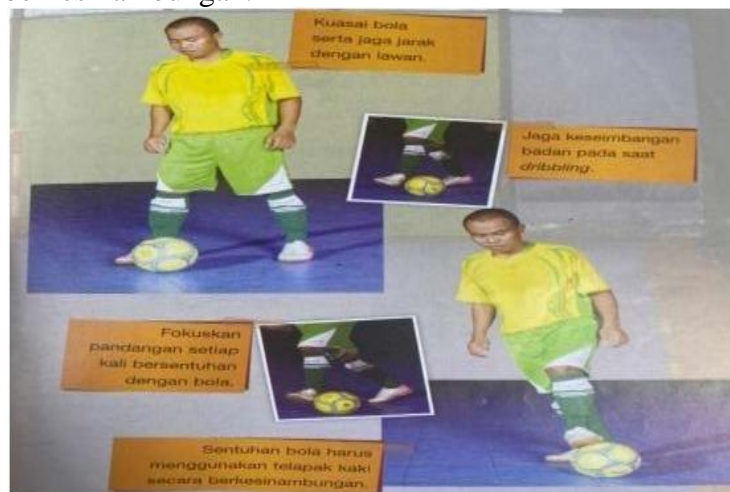
Gambar 3 Teknik Dasar Dribbling