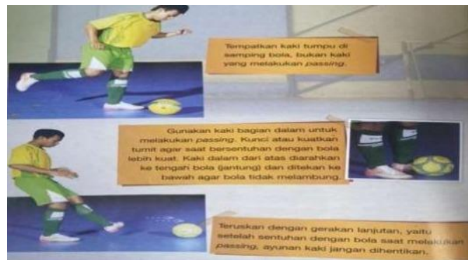
Gambar 1 Teknik Dasar Passing

futsal. Untuk menguasai ketrampilan passing diperlukan penguasaan gerakan sehingga sasaran yang diinginkan tercapai. (Justinus Lhaksana, 2011:30).